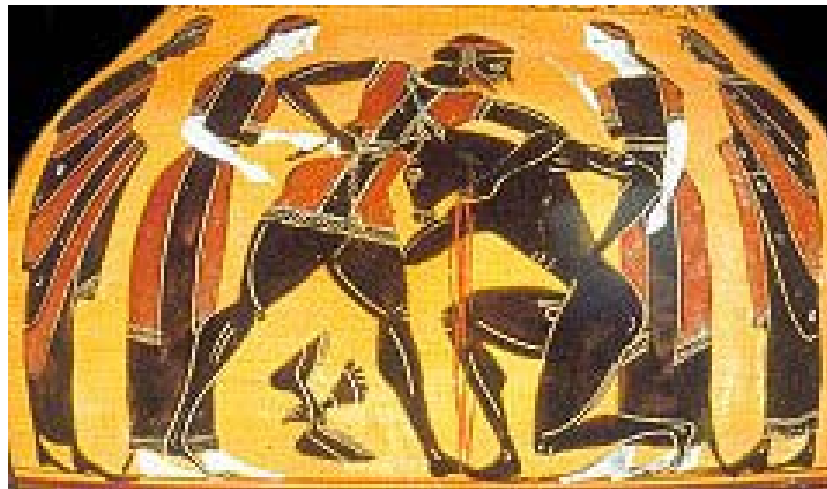
Theseus tötet den Minotaurus (schwarzfigurige Amphore)